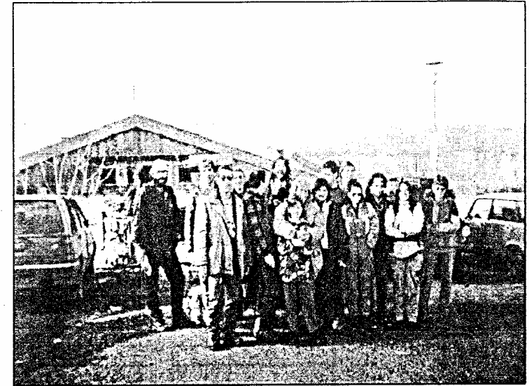
Сн.1 Членове на клуб "Хелектит" по време на републиканския пещерен сбор "Иван Вазов" - с. Карлуково, 1995 г.

С това нашето посещение в района на Шумен завърши. Допихме бирата, предоставена от „Шуменско пиво“ и си отидохме след едно 10 дневно интересно и полезно преживяване.